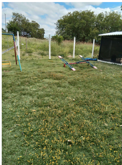
A grama está alta, não aparada. Mato terreno vizinho também