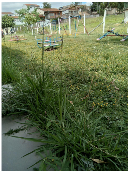
O mato está alto.