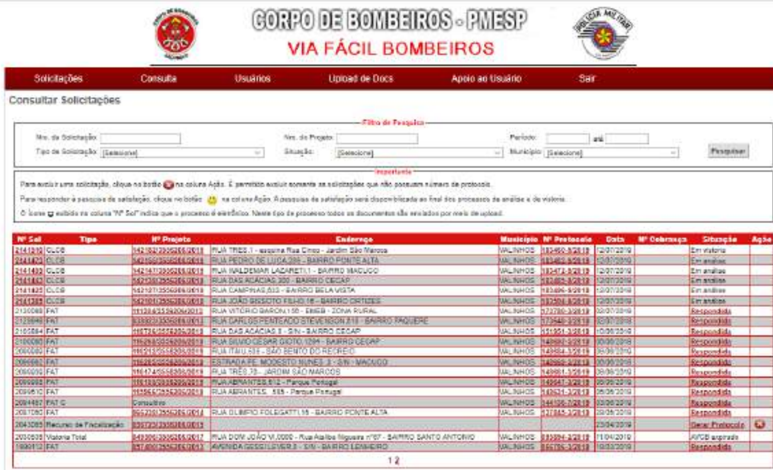
Figura 71 - Sistema Via Fácil Solicitações em Andamento II