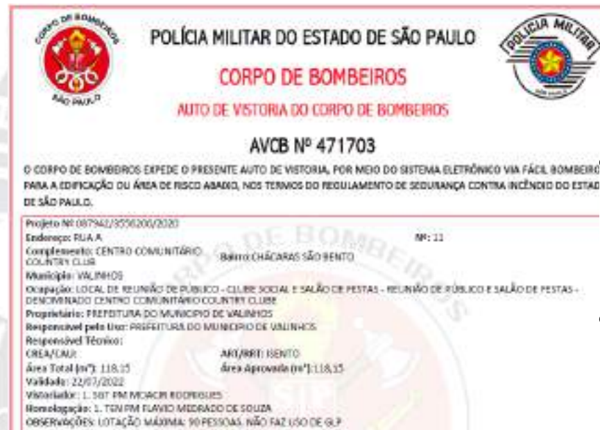
Figura 48 - AVCB CC Country Club