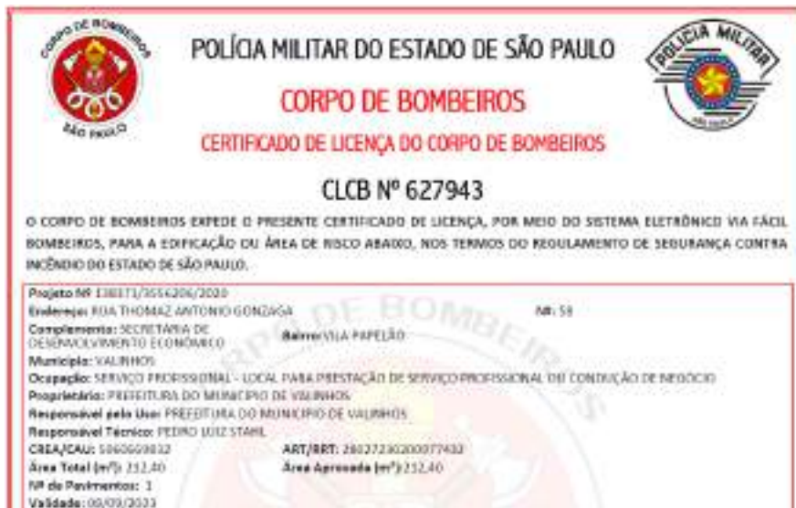
Figura 53 - CLCB Secretaria de Desenvolvimento Econômico