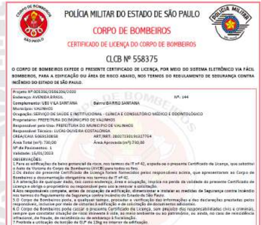
Figura 44 - CLCB UBS Vila Santana