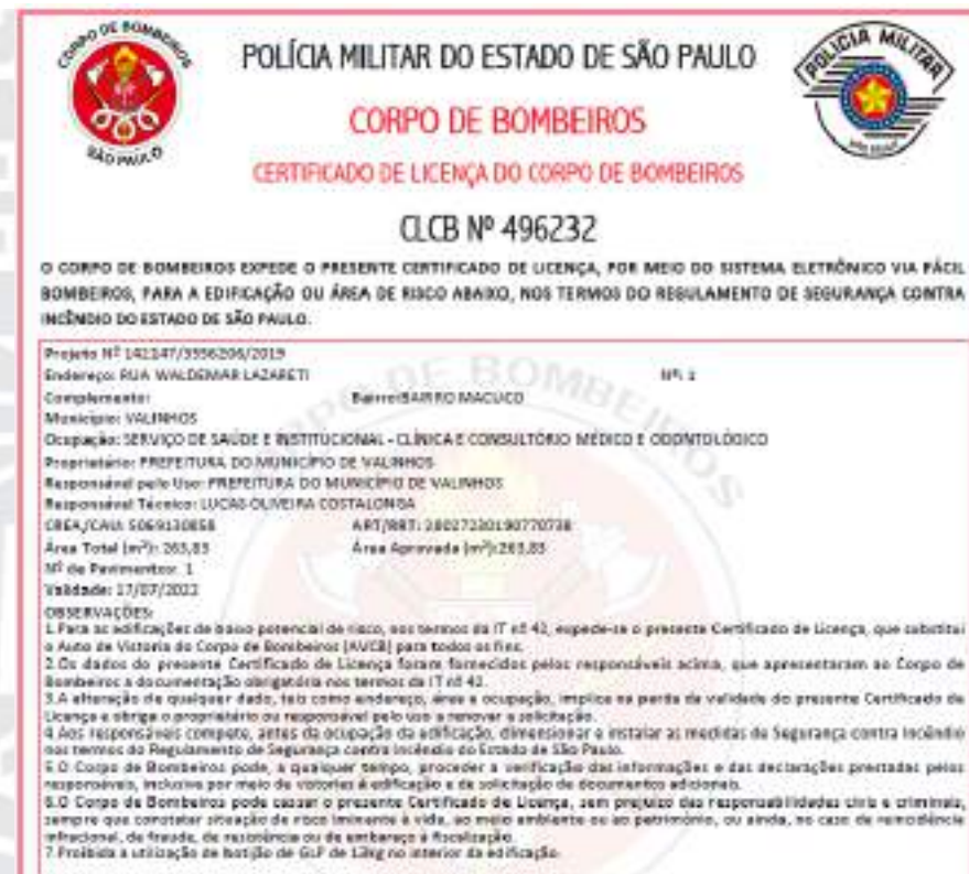
Figura 12 - CLCB UBS Macuco