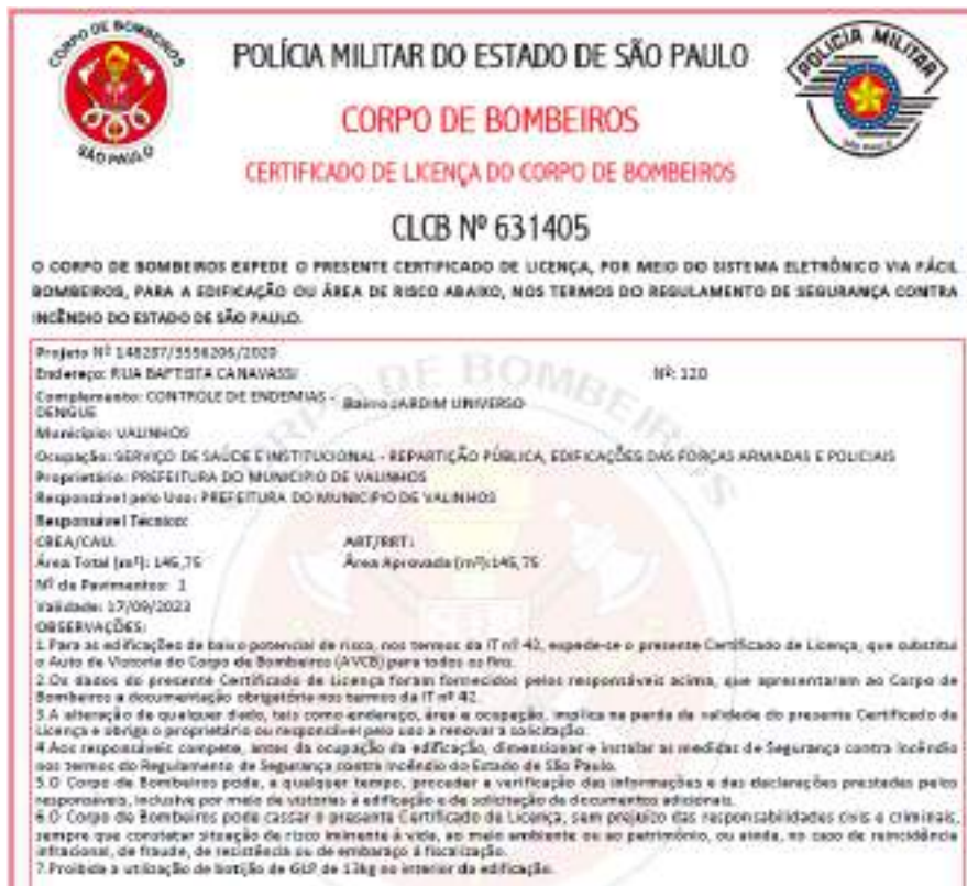
Figura 57 - CLCB Controle de Endemias - Dengue