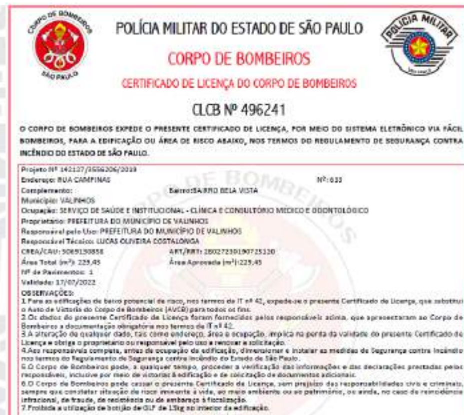
Figura 14 - CLCB UBS Imperial