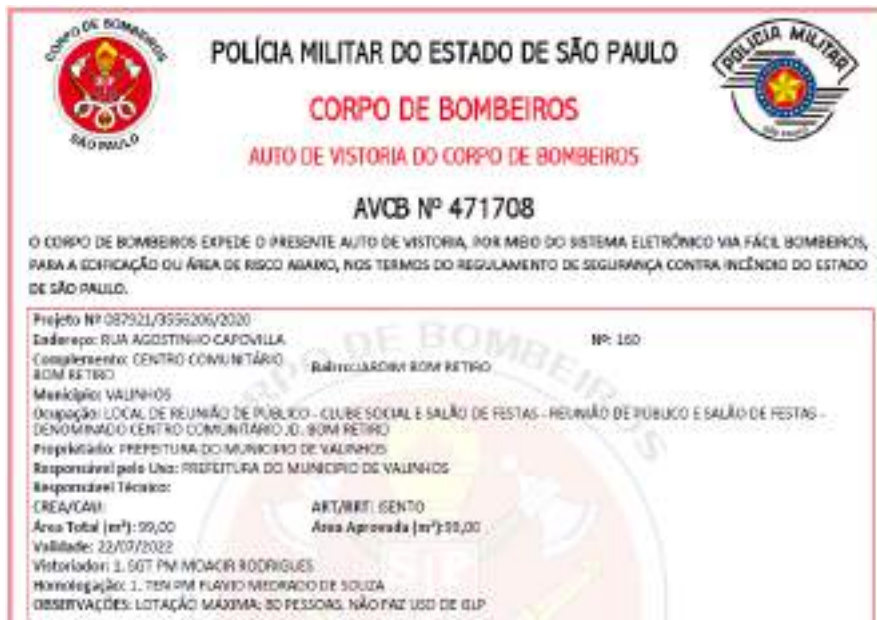
Figura 47 - AVCB CC Bom Retiro