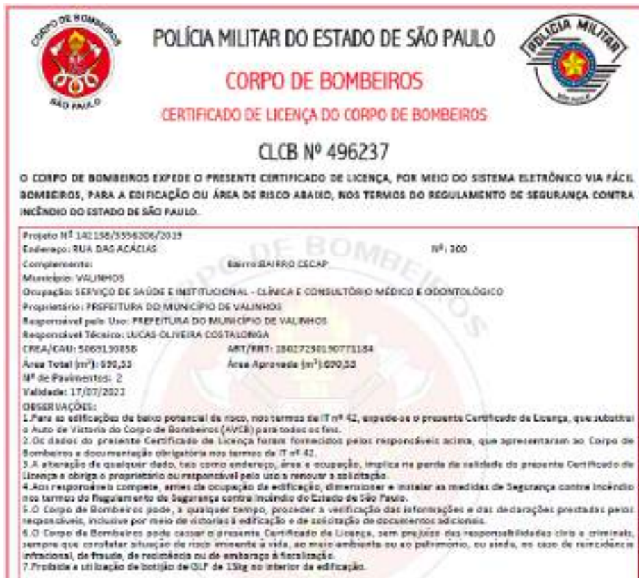
Figura 13 - CLCB UBS Jd. Paraíso