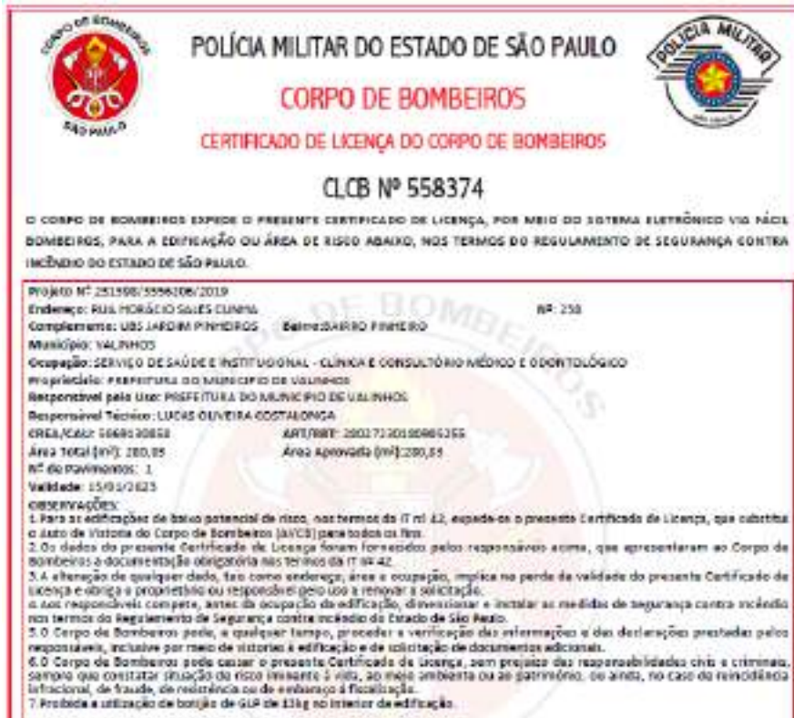
Figura 43 - CLCB UBS Pinheiros