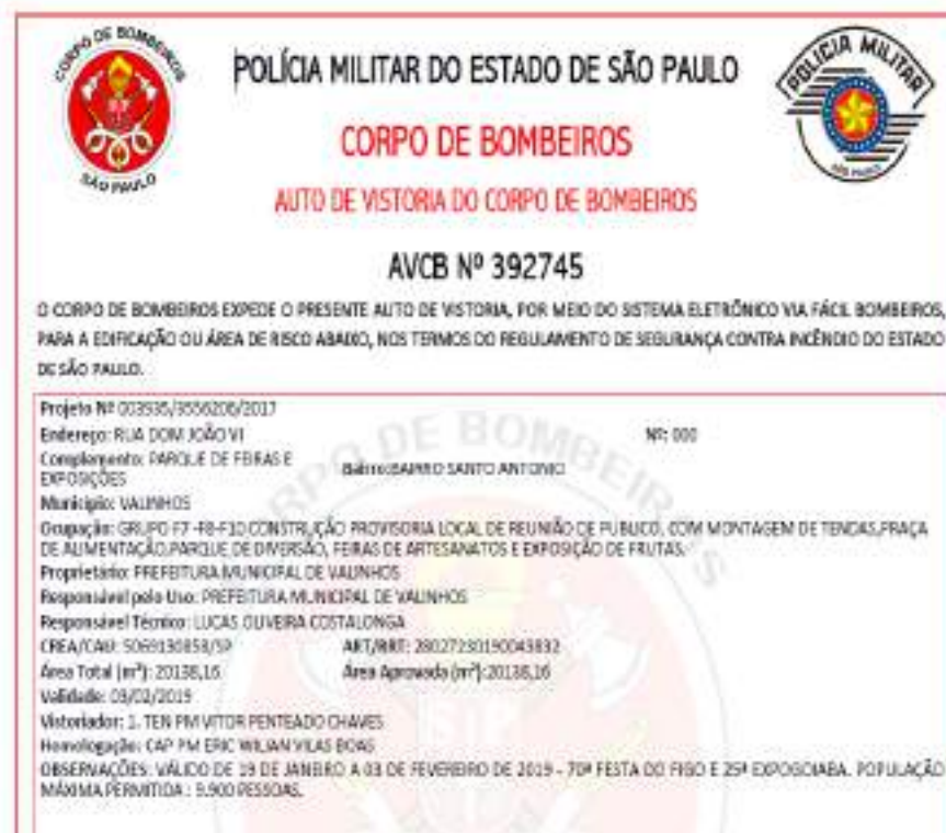
Figura 6 - AVCB Festa do Figo 2019