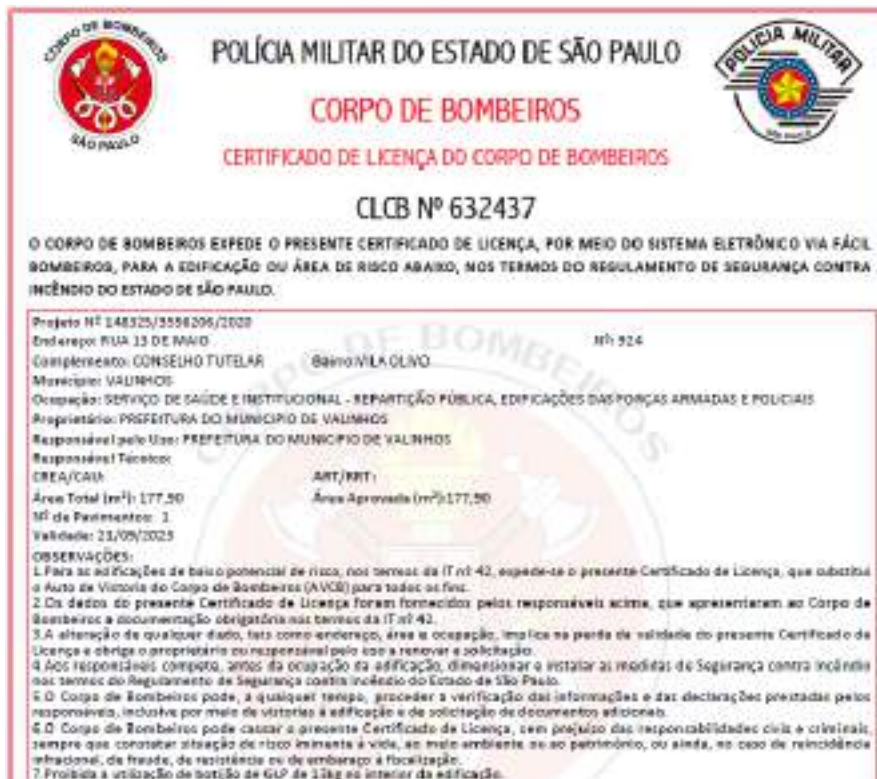
Figura 59 - CLCB Conselho Tutelar