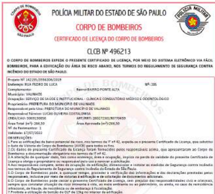
Figura 11 - CLCB UBS Maracanã