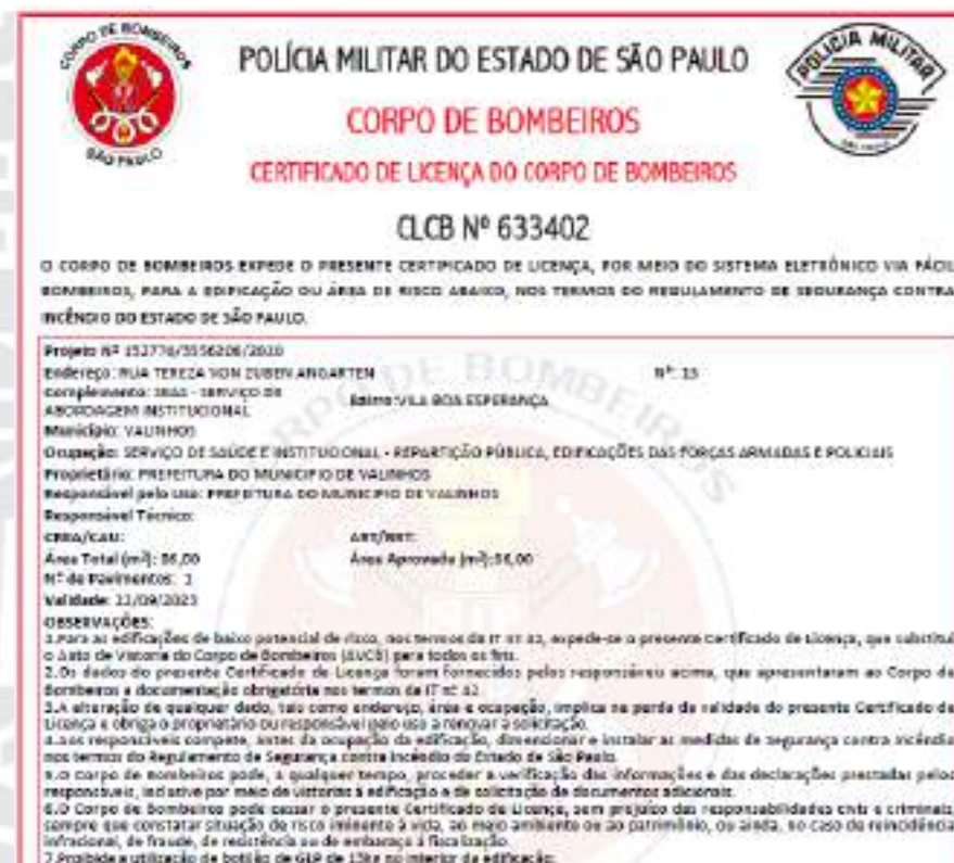
Figura 60 - CLCB SEAS