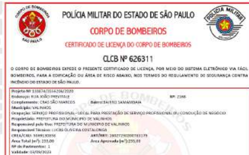
Figura 54 - CLCB CRAS São Marcos