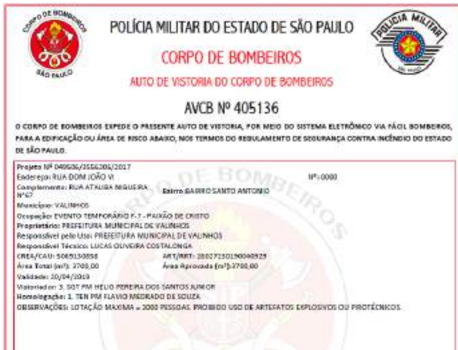
Figura 5 - AVCB Paixão de Cristo 2019