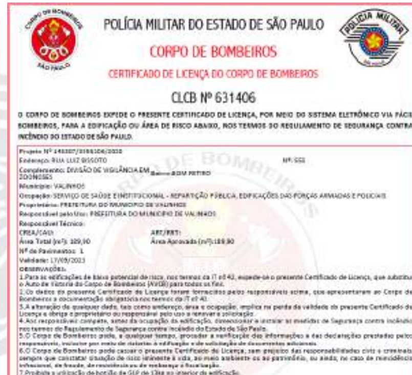
Figura 58 - CLCB Divisão de Vigilância em Zoonoses